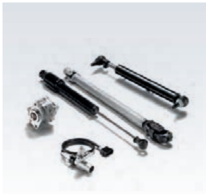
Originalni MAN-ovi blažilnik krmilnega mehanizma

Jaremski drogovi, gredi krmilja in krmilne črpalke so ključni elementi krmilnega sistema, ki dopuščajo zelo majhna območja odstopanja pri prenosu krmilnih ukazov na kolesa. Vse komponente so izpostavljene velikim silam in v nekaterih primerih tudi visokim temperaturam. Da bi lahko vedno znova prenesle te vplive in zagotavljale visok nivo varnosti, je odločilna njihova kakovost.