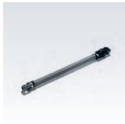
Originalna MAN-ova kardanska gred krmilja