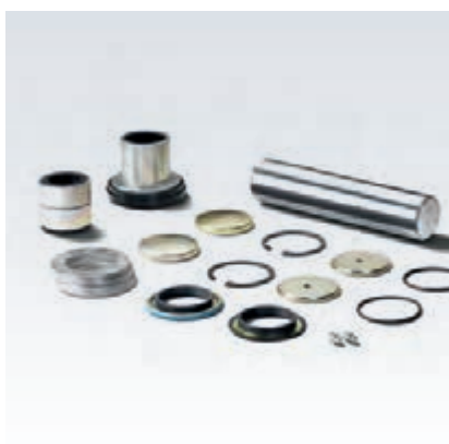
MAN originalni kompleti za popravilo premnika