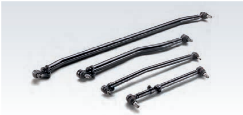
Originalni MAN-ovi krmilni in jarnski drogovi