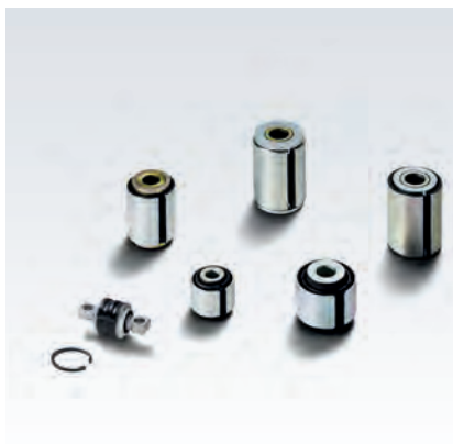
Originalni MAN-ove puše z regami